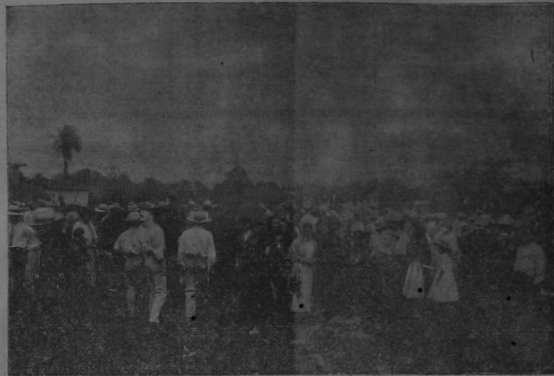
LA REUNION FERNANDISTA

cipio el sistema de pequeñas asambleas locales que eligen gradualmente sus propios diputados, miembros del Poder Legislativo (que debiera ser el poder presidente de la República) y al cual corresponde luego el