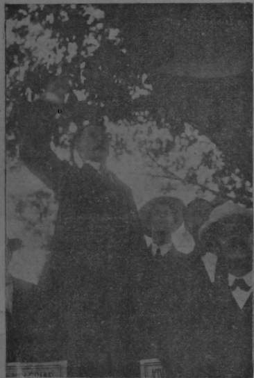
Don Rafael Iglesias hablando