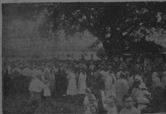
LA REUNION CIVILISTA