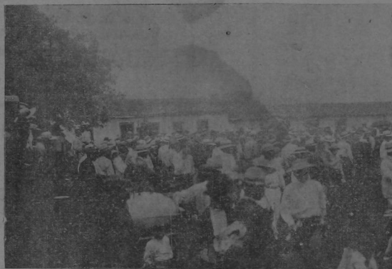
LA REUNION DURANISTA